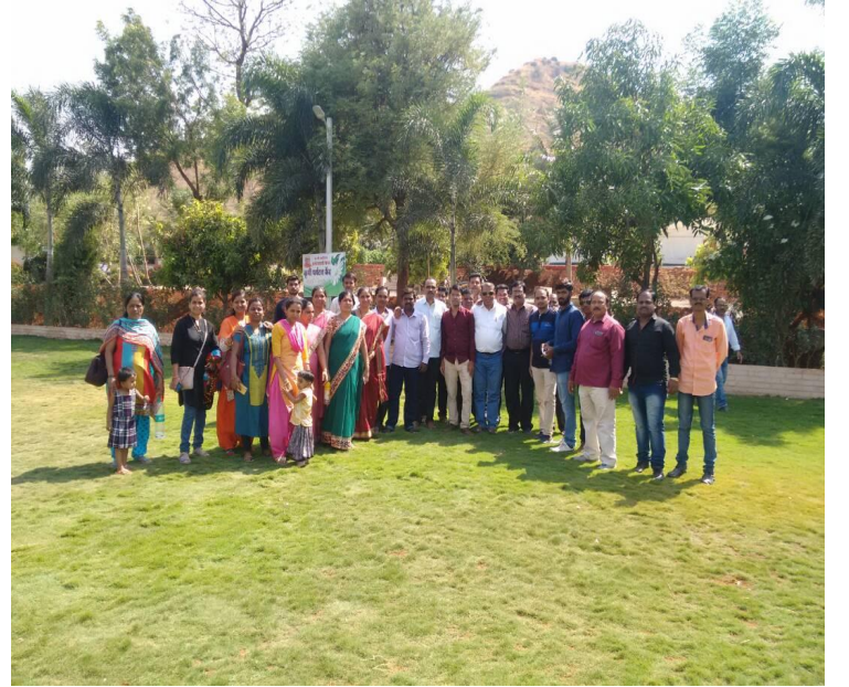
प्रशिक्षण काळातील क्षणचित्रे